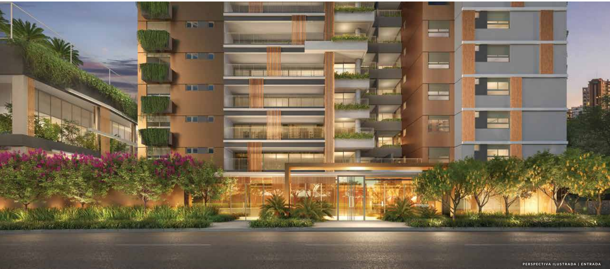
PERSPECTIVA ILUSTRADA | ENTRADA